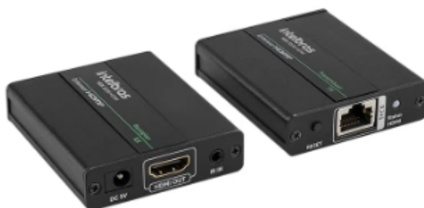
Figura 1 - Transmissor e receptor HDMI IP VEX 3120 da Intelbras

A solução a ser apresentada tem como referência o extensor de sinal HDMI VEX 3120 IP da Intelbras (ver Figura 1) para até 250 telas em Full HD, via rede lógica do Tribunal. A Arquitetura da solução está apresentada na Figura 2.