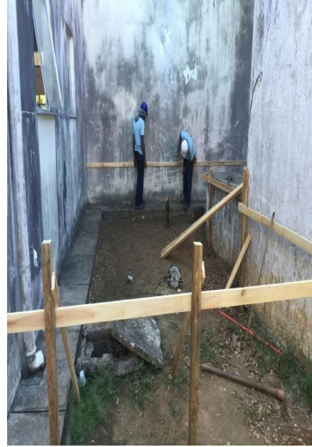
Locação da Obra