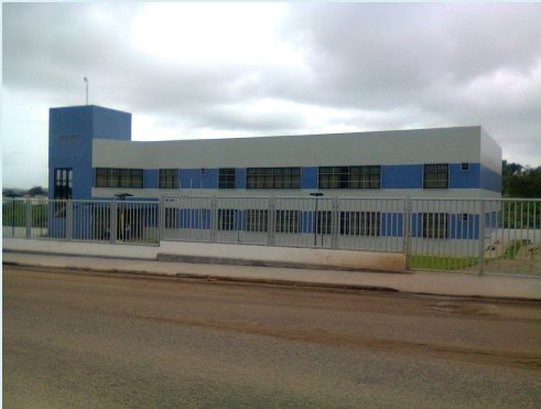
Fórum de Alagoíneas Fórum Desembargador Raymundo Figueirôa